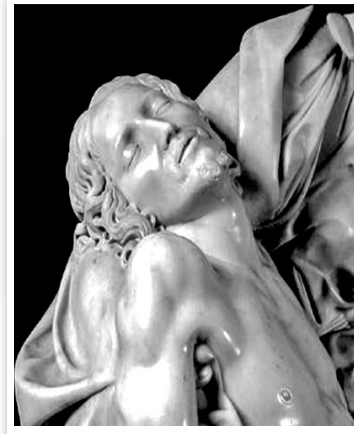
La Piedad (Miguel Ángel)

Pensar en la muerte de Cristo se traduce en una invitación a situarnos con absoluta sinceridad ante nuestro quehacer ordinario, a tomar en serio la fe que profesamos. La Semana Santa, por tanto, no puede ser un paréntesis sagrado en el contexto de un vivir movido sólo por intereses humanos: ha de ser una ocasión de ahondar en la hondura del Amor de Dios, para poder así, con la palabra y con las obras, mostrarlo a los hombres. La vida, el alma misma, es lo que pide el Señor. (...) Aceptemos sin miedo la voluntad de Dios, formulemos sin vacilaciones el propósito de edificar toda nuestra vida de acuerdo con lo que nos enseña y exige nuestra fe.