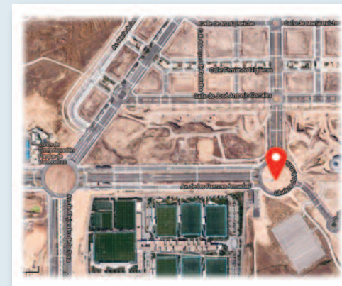
Sede de la beatificación Valdebebas. Madrid.